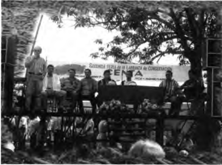
El acto inaugural de la feria