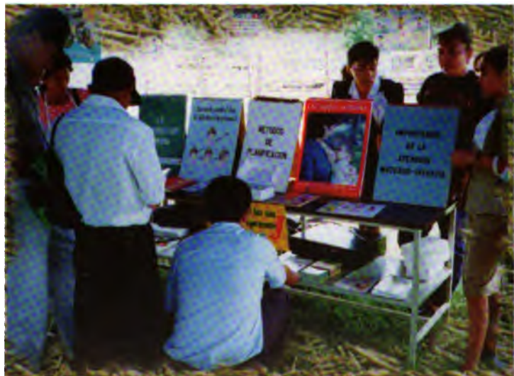
Género y planificación familiar también tuvieron su lugar en la Feria.

La participación de la comunidad de Guaymango fue activa mediante la visita a la feria y la venta de comidas típicas. La actividad se prolongó hasta horas de la noche.