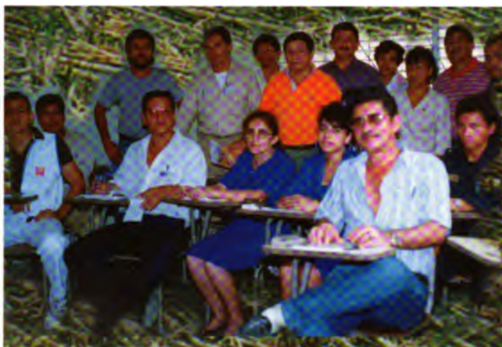
El Comité Local de Organización de la II Feria de la Labranza de Conservación.

Para la realización de este segundo evento se introdujeron dos cambios importantes en su organización con el fin de darle una mayor sustentabilidad.