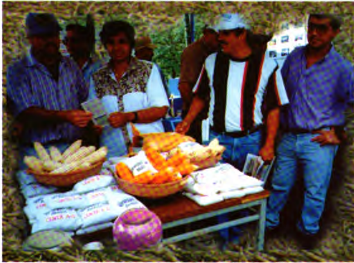
Muestras de las nuevas variedades de maíz expuestas por el CENTA

del área. En estas últimas, los participantes pudieron observar el efecto de la labranza de conservación sobre la calidad del suelo cuando se realiza en forma continua por varios años. El Programa de Fomento de la Tracción Animal (FOMENTA) realizó una demostración de la siembra con cero labranza mediante tracción animal. Durante las visitas a las exhibiciones, los agricultores y otros visitantes pudieron tener acceso a una gran cantidad de información disponible en forma de publicaciones.