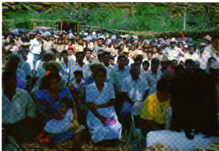
La I Feria de la Labranza de Conservación en Guaymango. Abril, 1995.

En abril de 1995, el Centro Nacional de Tecnología Agropecuaria y Forestal (CENTA), el Centro Internacional de Mejoramiento de Maíz y Trigo (CIMMYT) y el Programa Regional de Maíz (PRM) se