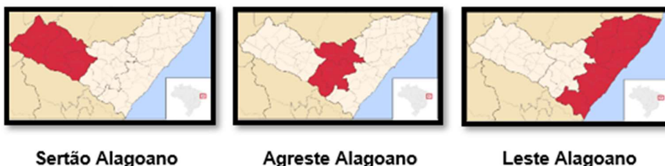
Figura 1. Distribuição geográfica das mesorregiões de Alagoas.

A Figura 1 apresenta a localização geográfica das três mesorregiões de Alagoas.