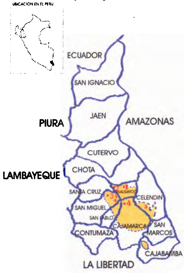
Cuenca Lechera de Cajamarca