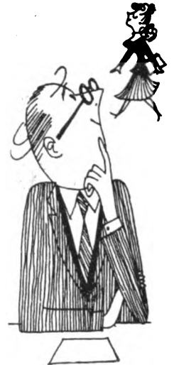
SE DISTRAE FACILMENTE