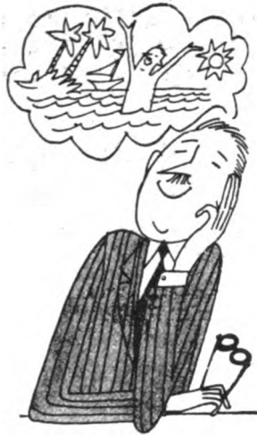
VIAJA CON LA IMAGINACION