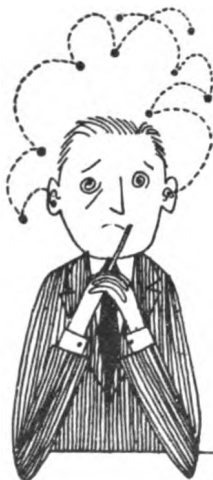
ESCUCHA EN FORMA INTERMITENTE