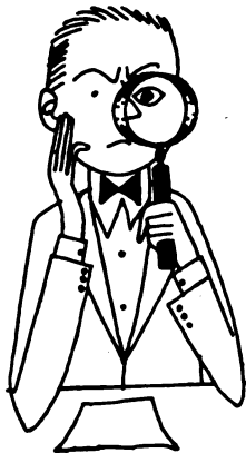
ESCUCHA Y ANALIZA