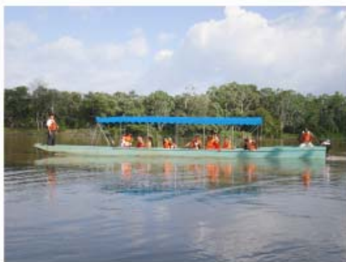
Iniciativa de Transporte Turístico Comunitario, Proyecto CEGEL – FIDA