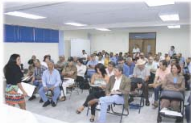
Reunión de Presentación del Plan de Acción para la Competitividad de la Cadena de Frutas