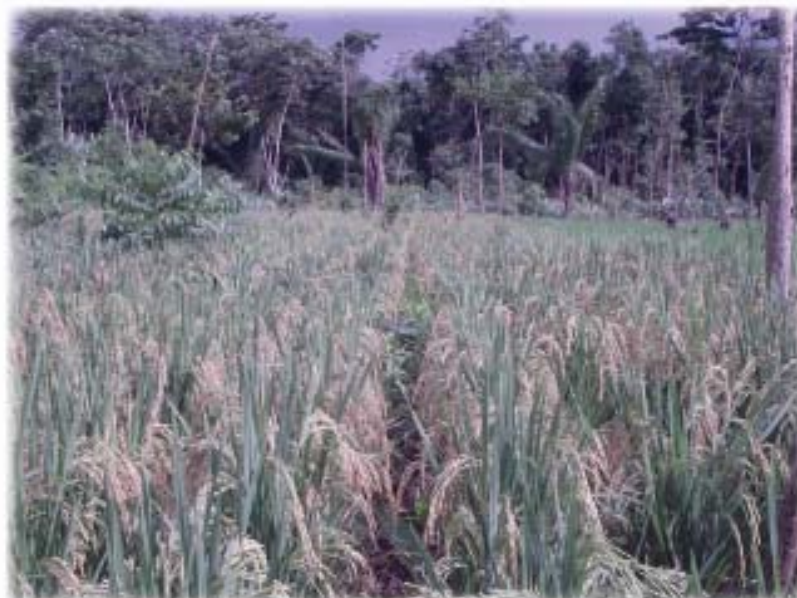
Parcela de Arroz sembrada a chuzo, de Productores Organizados de Darién