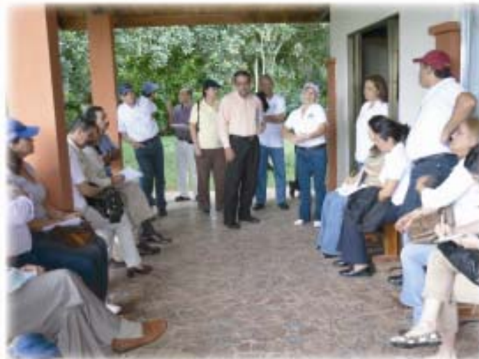
Tercer Encuentro de la Red de Agroindustria Rural – REDAR en Chiriquí