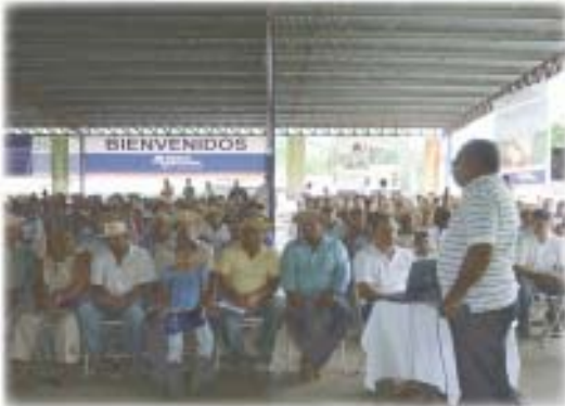
Participación del IICA en el Encuentro Agropecuario de Tanara