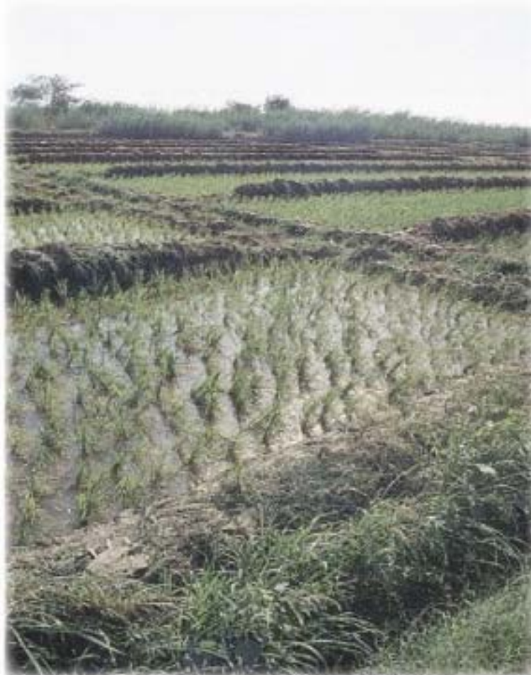
Cultivo de Arroz, bajo Fanguero