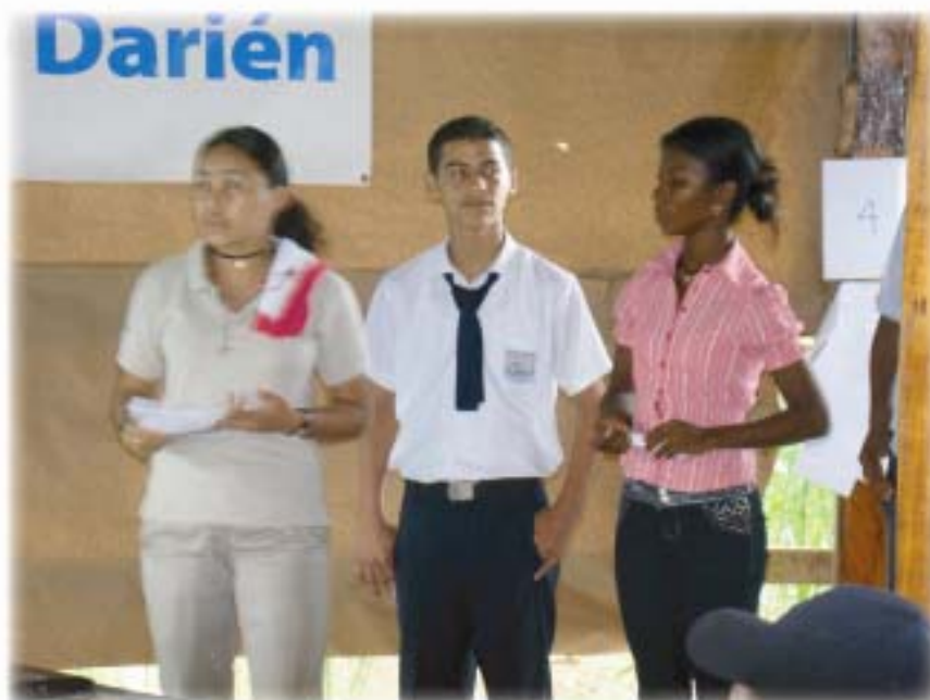
Consulta de ECADERT a jóvenes del territorio de Darién