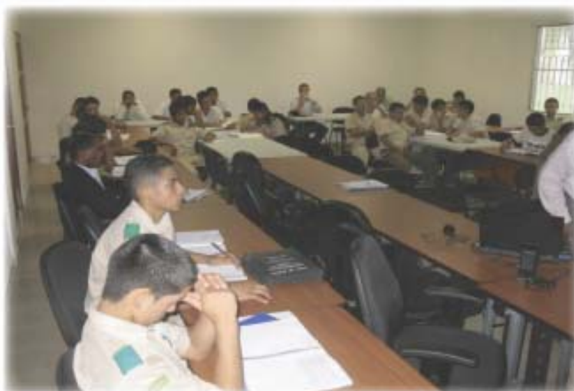
Foro Nacional de Jóvenes Rurales Líderes de Panamá