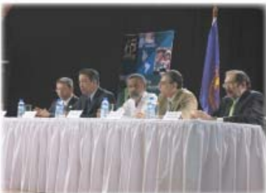
Mesa Principal del Evento de Rendición de Cuentas 2008