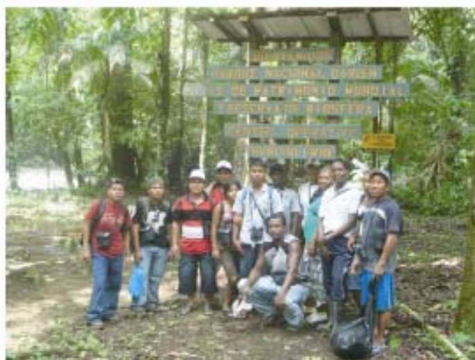
Capacitación de Jóvenes - Futuros Guías Turísticos, en el Parque Nacional Darién