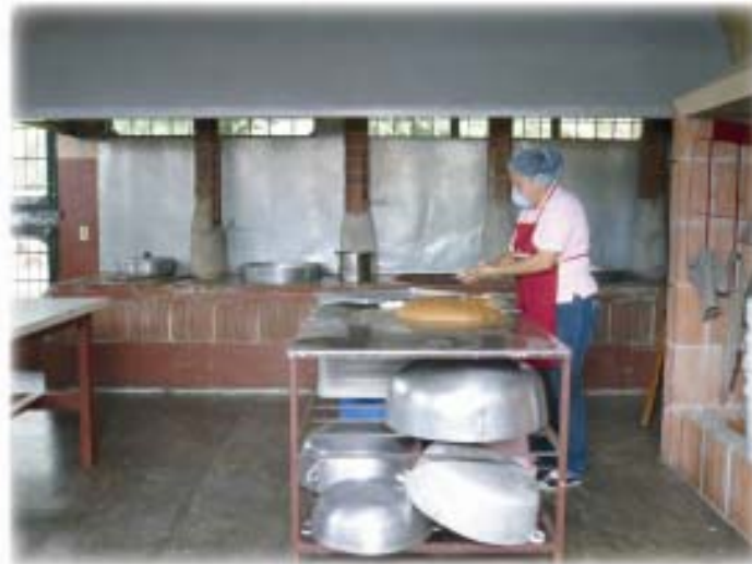
Agroindustria visitada durante el Curso SIAL de REDAR