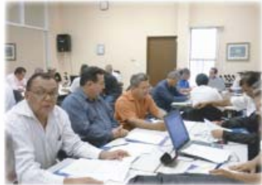
Validación de la Propuesta de Extensión con Directivos del Sector Público Agropecuario