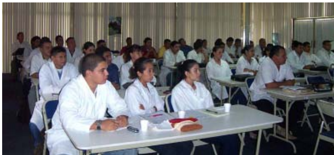
A través del Centro de Capacitación del IICA se han capacitado a casi nueve mil productores, y profesionales vinculados al trabajo agropecuario nicaragüense.