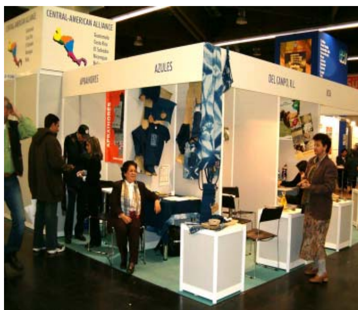
En Acceso a Mercados Internacionales, su objetivo básico fue diversificar los mercados para las empresas con experiencia en exportaciones.

ductos en el mercado de Los Ángeles, USA. Se espera durante el año 2005 la realización de los primeros negocios dado el óptimo resultado de la acción desarrollada con la Segunda Plataforma de Exportación. El objetivo de esta metodología fue introducir a los empresarios que nunca han exportado, en temas que les permitan realizar con éxito una exportación. En la primera etapa se planificaron ocho módulos