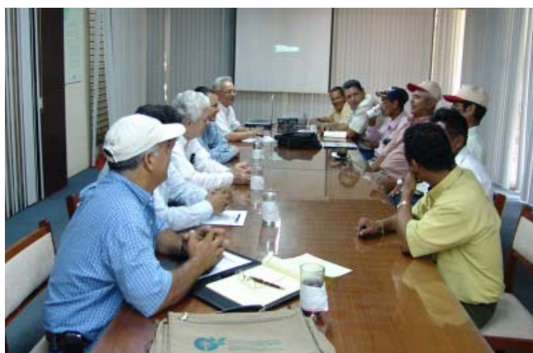
Se destacan los apoyos a eventos, foros, diálogos, concertación y amplia difusión y seguimiento a los procesos de negociaciones de los Tratados de Libre Comercio.

pendiente 231 posiciones. Conjuntamente con el MIFIC se apoyó en la elaboración de la propuesta de armonización de las Normas de Origen entre CA y México. También se trabajó el tema de la Armonización del Mecanismo de Administración de Donaciones de Alimentos e Insumos Agropecuarios que se ha presentado en dos ocasiones a nivel regional, y normado con ello la posición nacional. También se