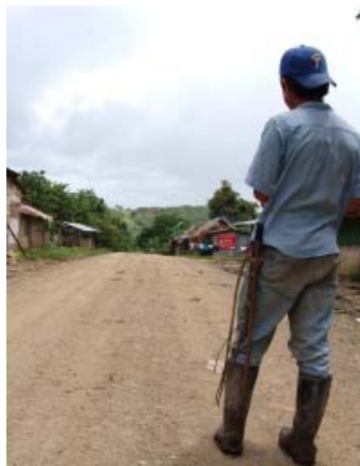
El IICA contribuyó a la rehabilitación de 106.5 km de caminos rurales en áreas de alto potencial productivo y agroexportador.

Para el fortalecimiento de las comunidades rurales, y con el apoyo de CARE, IDR y financiamiento de AID, IICA Nicaragua realizó con éxito el componente de caminos, rehabilitándose 106.5 Km. de caminos rurales en áreas de alto potencial productivo y agro exportador en los departamentos de Chontales, Boaco, Matagalpa y Jinotega, mejorando el bienestar de las familias rurales de la zona al facilitar el acceso a bienes y servicios entre los productores, asociaciones de productores, compradores y comercializadores del área. Por otro lado, se logró capacitar para el mantenimiento de los caminos y movilizar los recursos humanos de las municipalidades y las comunidades alrededor del enfoque de desarrollo integral territorial del proyecto.