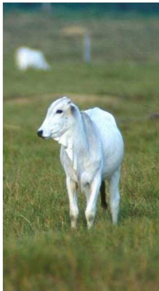
Los productos derivados de la actividad ganadera generaron las mayores ventas en el mercado internacional.

Se impulsó las áreas de comercialización y mercadeo, innovación y transferencia de tecnologías, incentivos para la adopción tecnología, capacitación y entrenamiento en producción y comercialización, promoción y desarrollo de exportaciones, programa de ruedas de negocios, contacto con compradores, giras y participación en ferias en el país y en el extranjero, lográndose con estas acciones ventas estimadas en un total de US$ 15,725,161, de los cuales US$ 3,385,543 fueron en productos agrícolas y US$ 12,339,618 en productos ganaderos (US$ 11,727,304 en quesos de exportación y US$ 612,314 en ganadería de leche y carne).