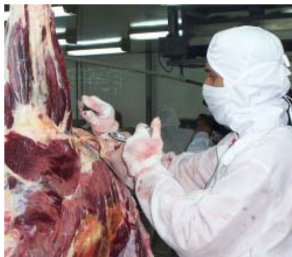
Las diversas acciones para promover la inocuidad de los alimentos y la sanidad agropecuaria fueron realizadas por el IICA en conjunto con la Dirección de Sanidad del Ministerio Agropecuario y Forestal (MAGFOR) de Nicaragua.

de la sanidad agropecuaria e inocuidad de los alimentos a nivel institucional de los sectores público y privado en el área de ganadería; acción que contó con la participación de los actores públicos y privados y donde se destacaron recomendaciones y se priorizaron áreas para su modernización.