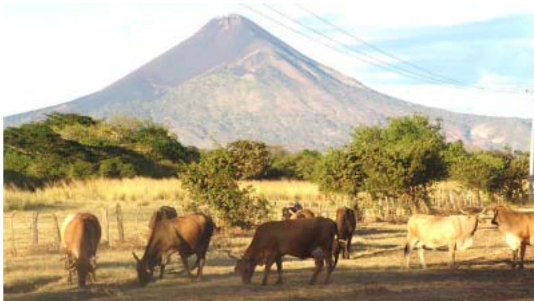
Se realizaron estudios para determinar el actual impacto de los sistemas de producción ganadera en el medio ambiente.

La diversificación de las zonas cafetaleras de Jinotega y Matagalpa con acciones de reforestación y conservación del medio ambiente, pero con árboles frutales y maderables que generen ingresos en el mediano plazo, fue, con el apoyo de USAID, una de las acciones impulsadas en estos departamentos. Se decidió introducir bancos de germoplasma e iniciar plantaciones comerciales. Un total de 12 416 árboles frutales y 24 084 árboles maderables fueron introducidos en 56 parcelas demostrativas y dos centros de producción (viveros).