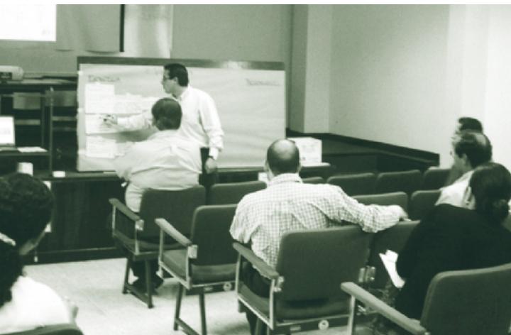
El análisis de desempeño de los Servicios Veterinarios, con la participación de los sectores público y privado ha conducido a compromisos de Estrategia y Visión Común.

SVN, se han desarrollado Talleres de Visión Común en las agrocadenas de los sectores Apícola, Acuícola y Porcino. La participación activa de las Cámaras y del personal de la Dirección de Salud Animal del MAG han generado resultados específicos que iniciarán un proceso de mejora continua en las variables identificadas como críticas por los asistentes representativos de cada sector.