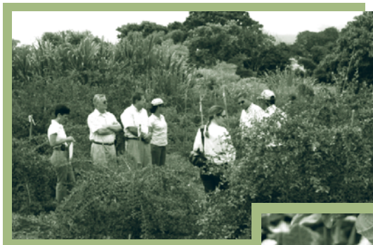
Vinculación de pequeños productores de áreas de desarrollo rural a actividades de innovación tecnológica y agroindustria de frutales.

Finalmente, en coordinación con la DDRS y en un marco de colaboración de esta unidad con Agriculture and Agri-Food Canada (AAFC), se elaboró un estudio sobre las políticas agroambientales en el país, que pretende mejorar la comprensión sobre su situación y orientar potenciales acciones en el tema.