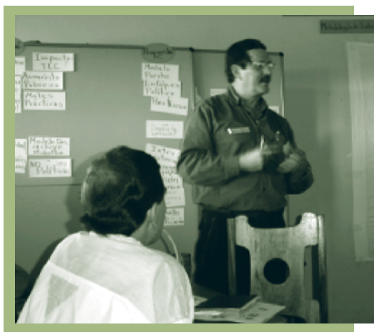
Actividades de educación y explicación del EDRS con actores de la Zona Norte del país.

En el marco del convenio MAG/PDR-IICA y el proyecto piloto de Desarrollo Rural con enfoque territorial en los cantones de la frontera norte del país, se completó el levantamiento de información básica sobre la zona de influencia (tendencias de la zona, inventario de actores, inventario de inversiones, identificación y sistematización de experiencias relevantes, representación cartográfica, identificación de potencialidad del turismo rural) que sirvió para orientar el proceso de intervención y facilitó el inicio de la conformación de grupos locales de desarrollo en las comunidades seleccionadas, que posteriormente recibirán apoyo para su fortalecimiento. Estas acciones se complementaron con una serie de encuentros ante autoridades de diversas instancias de la región, con la intención de promover su participación.