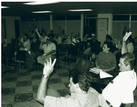
Proceso de motivación, capacitación y creación de la Subasta de Tomate.

forma autogestionaria por compradores y productores de tomate, cuya misión es encaminar y desarrollar un sistema de comercialización transparente que beneficie a todos los actores de la cadena.