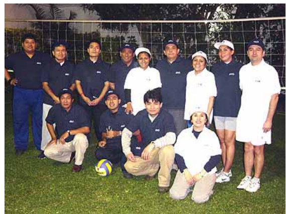
Foto del recuerdo de las tardes de deporte de los días viernes.