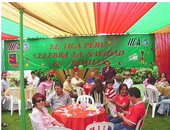
Celebración de Navidad con familiares y amigos del IICA.