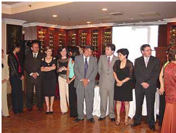
Compañeros de Trabajo de la Oficina del IICA en el Perú, presentes en la celebración del término de las actividades laborales de la Oficina en el año 2005, realizada el 10 de diciembre.