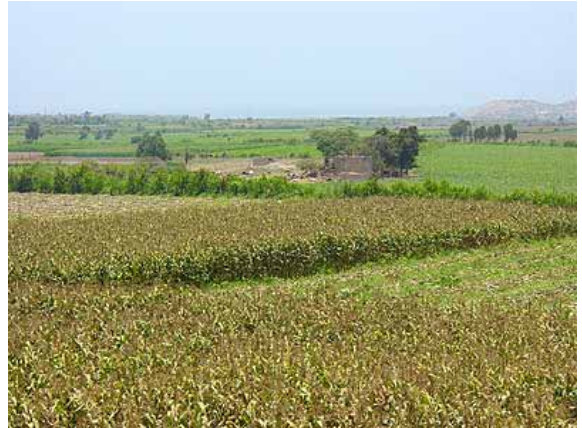
Vista panorámica de parcelas de maíz amarillo duro en la localidad de Carquín (Valle de Huaura), Febrero del 2005.