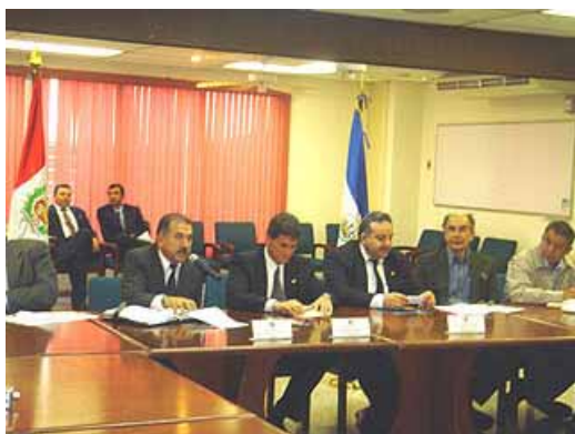
Ministro de Agricultura, Manuel Manrique con funcionarios y dirigentes agrarios del Perú en pasantía realizada a El Salvador, en compañía del Ministro de Agricultura de dicho país, Mario Salaverría.

Se fortalecieron las capacidades de 30 profesionales, entre funcionarios del MINAG, dirigentes gremiales y empresarios del sector agropecuario, en el seguimiento y definición de posiciones de negociación orientadas al libre comercio agrícola, a través de seminarios, talleres y pasantías al extranjero (El Salvador y México).