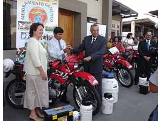
El Ministro de Agricultura del Perú Álvaro Quijandría (†), en compañía de la Agregada Agrícola de la Embajada de los Estados Unidos Melinda Sallyards, entregando equipo de inseminación artificial de Ganado.

Asimismo, se viene apoyando técnica y administrativamente a la consolidación de una Red Nacional de Postas de Inseminación Artificial, autogestionarias y sostenibles, bajo un esquema empresarial privado que permite brindar el servicio con mayor efectividad, cada una de las cuales en su inicio se financia parcialmente con recursos de las municipalidades locales y de un fondo local; en una primera etapa se reactivaron 20 postas, ubicadas en los departamentos de Puno, Cusco, Ica, Moquegua, Tacna y Lima.