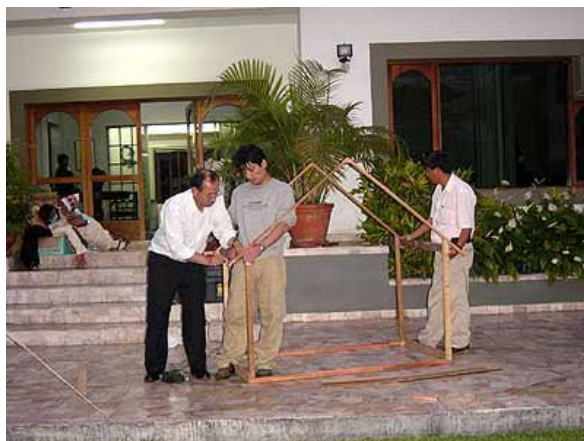
Preparativos de navidad, construyendo la estructura del nacimiento.