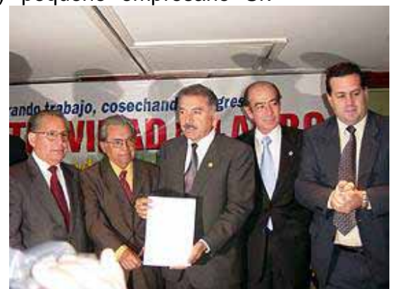
Manuel Manrique, Ministro de Agricultura; David Lemor, Ministro de Producción; Alfredo Ferrero, Ministro de Comercio Exterior y Turismo, en la suscripción del "Acuerdo de Competitividad para la Cadena Maíz Amarillo Duro -Avicultura- Porcicultura".

Encuentro Andino de Empresas Rurales de Base Biotecnológica en el Marco del Desarrollo Endógeno, realizado en Maracay (Aragua) Venezuela por la Gerencia General del Instituto Nacional de Investigación Agropecuaria (INIA), con el auspicio del Ministerio de Ciencia y Tecnología (MCT), del Fondo Nacional de Ciencia y Tecnología (FONACIT) de este país, en coordinación