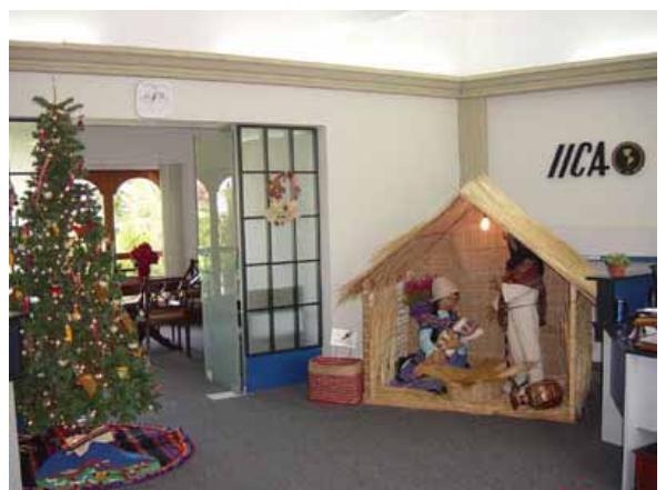
Nacimiento con motivos andinos instalado en la Sala Principal de la Oficina.