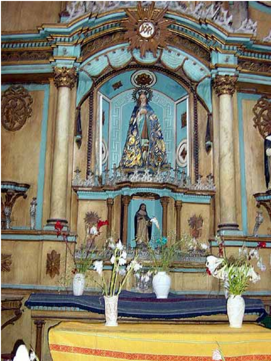
Altar de Iglesia Colonial de Vilcahuaura (Valle de Huaura).