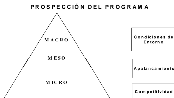
Gráfico N° 4.3.1 Prospección de un Programa de intervención

Este trabajo debe comprender la organización de los roles de los agentes que intervienen dentro de un círculo concéntrico para el desarrollo de la actividad cafetalera (Gráfico N° 4.3.2): políticas gubernamentales, normas, enfoques de intervención, estrategias y recursos; en la orientación de apoyar el desarrollo de los agricultores y sus organizaciones por segmentos específicos y no masivos como se ha intentado hasta la fecha.